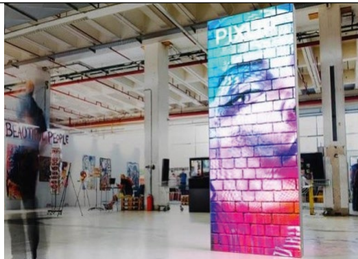
Beispiel: beleuchtete Rückwand