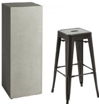
Beispiel: Hocker & Counter

Grundausrüstung: Strom, WLAN, Hocker, Counter & beleuchtete Rückwand (individueller Druck) inklusive